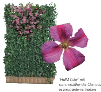
Abbildung 2 Variante für eine Hecke am laufenden Meter