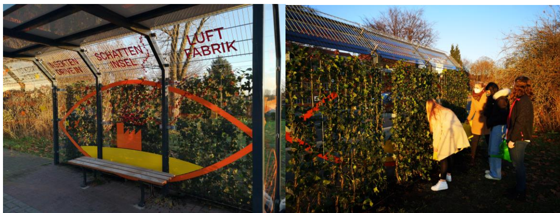
Abbildung 1 Die Schatteninsel im Stadtteil Bahnhof „Weg der Jugend“

Die Begrünung der Bushaltestelle im Bereich Bahnhof ist ein Pilotprojekt und einfaches Beispiel für viele andere Bushaltestellen. Die Gewinner*innen des ersten Preises aus dem Wettbewerb „Jugend dreht am Klimawandel“ setzen hier ihr Preisgeld ein und schafften so eine sichtbare Veränderung in der Stadt. Unterstützt wurden Sie dabei vom Bauhof und Fachbereich 3 der Stadt Boizenburg, PLATZ-B und finanzielle durch die Spende der Bürgerstiftung Region Boizenburg. Meht Infotmrnationen zu dem Mehrwert einer begrüneten Bushaltestelle finden sich hier: www.platzb.de/schatteninsel